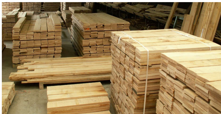
27mm QF23x sec séchoir