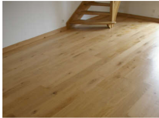
Lames de terrasse, bardage, parquet .....