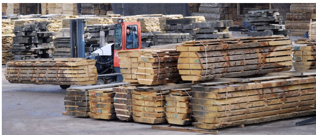
PLOTS (QBA Sec séchoir)