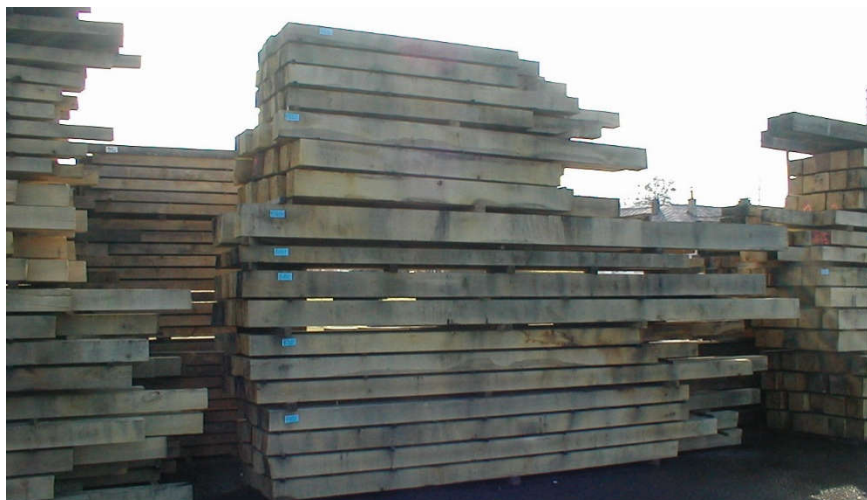
CHARPENTE (Frais de Sciage et ressuyé)