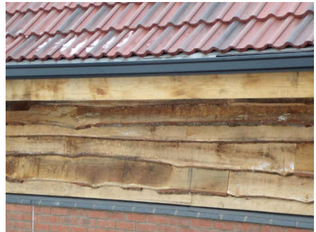
Bardage semi-avivé, Featheredge .....